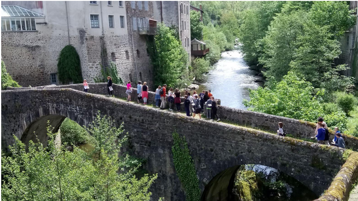
Olliergues – Le pont sur la Dore – Parc naturel régional Livradois-Forez