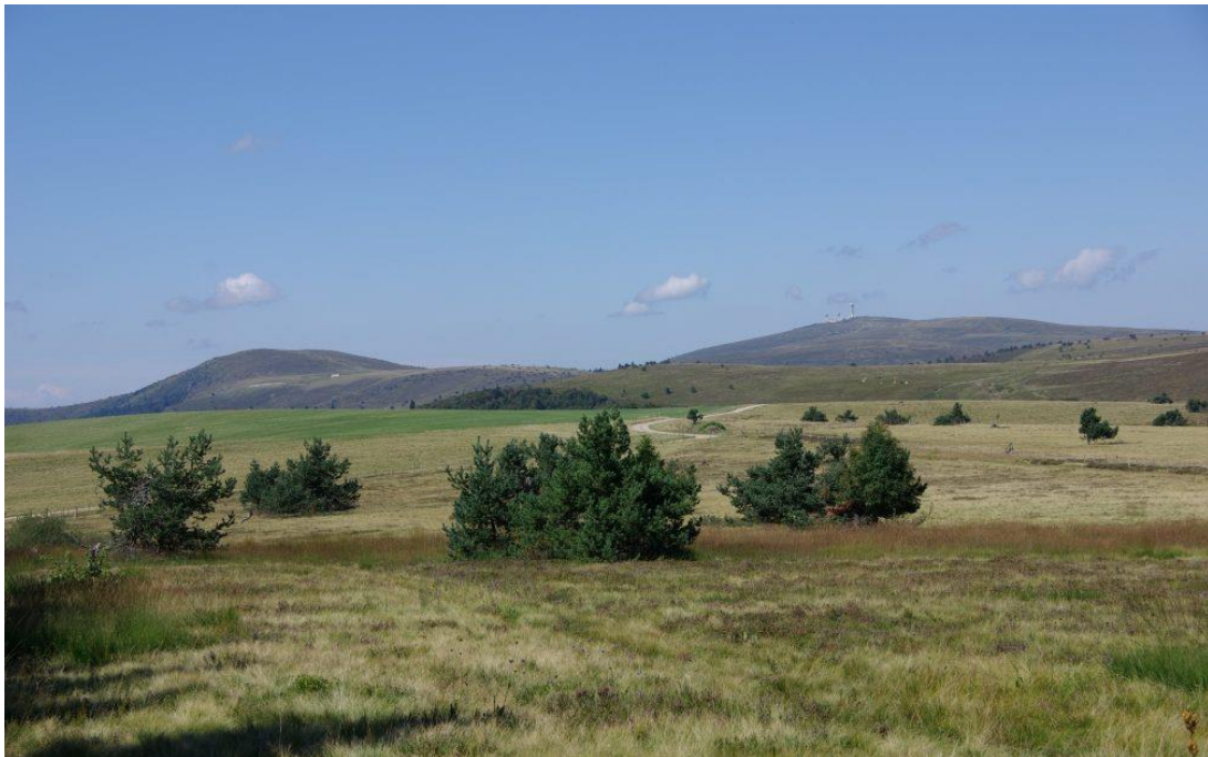
Hautes-Chaumes du Forez - Parc naturel régional Livradois-Forez

Lieu à la fois singulier et emblématique du territoire, les Hautes-Chaumes du Forez constituent un paysage unique et majestueux, aux équilibres fragiles, caractérisé par de vastes surfaces de landes à perte de vue, issues de l'activité pastorale présente depuis plusieurs siècles. Les jasseriers , habitats temporaires couverts de chaumes, liés au pastoralisme, ponctuent les horizons et renforcent le caractère patrimonial des monts du Forez. Seul secteur du territoire où l'étage végétal subalpin est représenté, la conjugaison du climat, de la géologie et des pratiques d'estive ininterrompues a favorisé la présence d'habitats naturels et d'espèces remarquables.