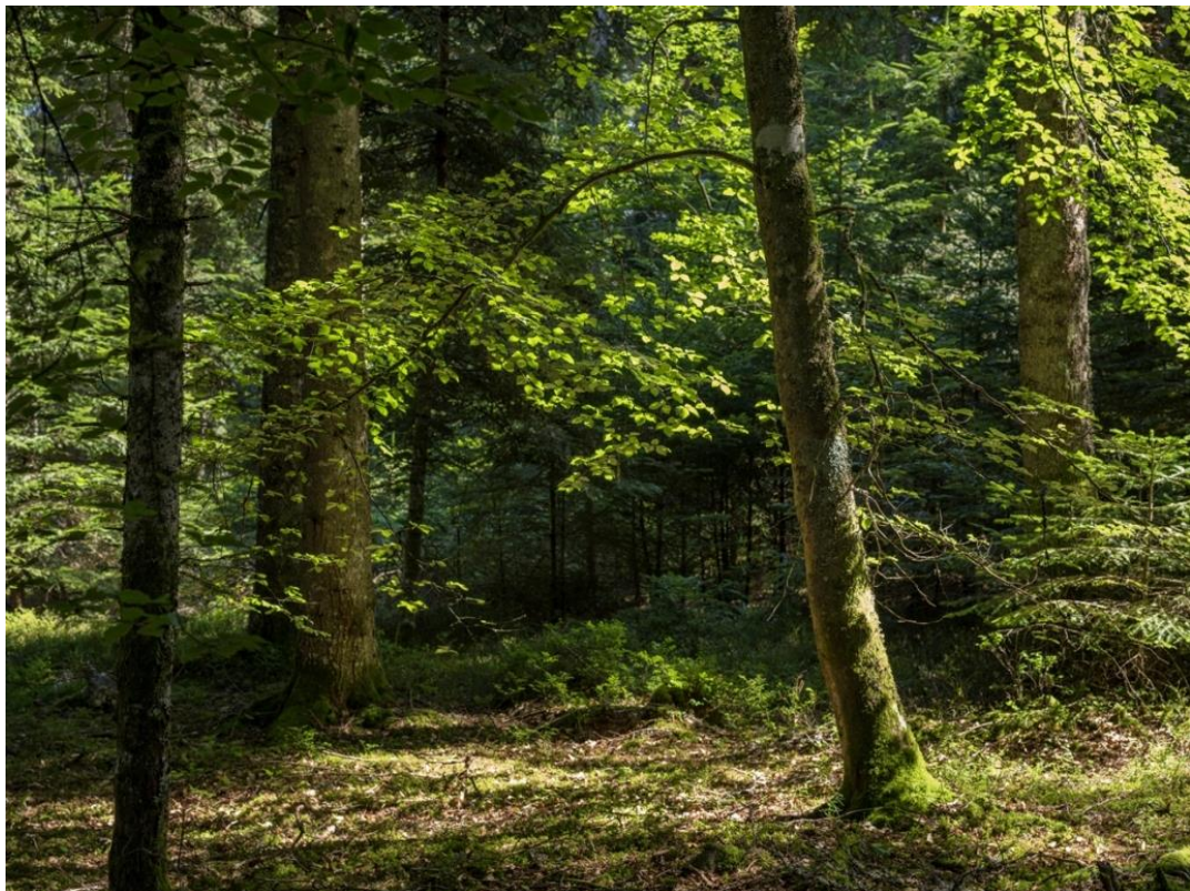
Chambon-sur-Dolore - Parcelle lauréate du SylvoTrophée 2021 du Parc naturel régional Livradois-Forez