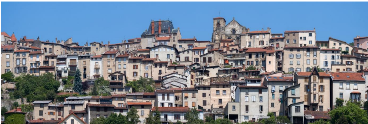
Ville Haute de Thiers PNR Livradois-Forez

Enfin, les enjeux spécifiques à la mise en œuvre de la Charte sont identifiés ; ils concernent essentiellement l'organisation de l'animation territoriale et le rôle du syndicat mixte du Parc naturel régional Livradois-Forez.